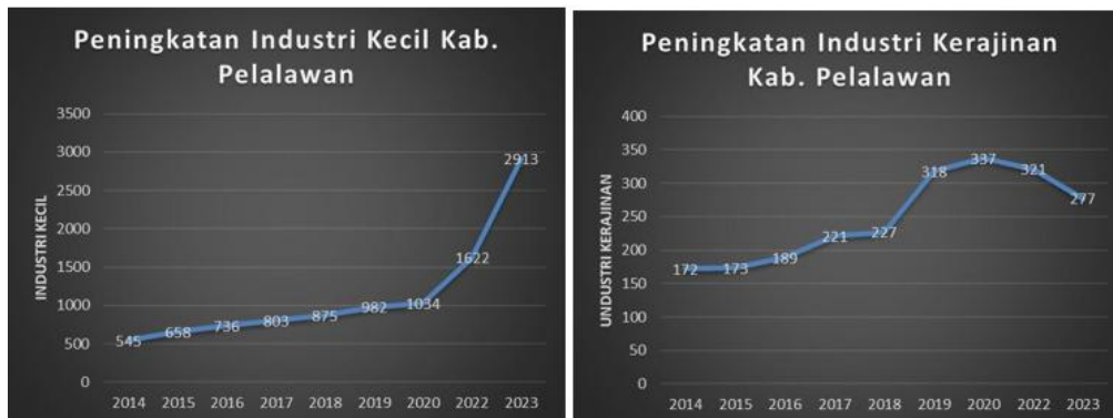
Gambar 4.3 Peningkatan Industri Kecil dan Industri Kerajinan Kab. Pelalawan

Data industri kecil menunjukkan adanya peningkatan jumlah usaha pada sektor tertentu, namun di sisi lain terjadi penurunan pada industri kerajinan. Hal ini mengindikasikan bahwa tidak semua program pelatihan dan pemberdayaan ekonomi yang dilakukan melalui CSR dapat berkelanjutan. Keberhasilan program sangat dipengaruhi oleh kesesuaian antara jenis pelatihan, ketersediaan bahan baku, dan permintaan pasar. Contoh industri yang relatif bertahan adalah kerajinan batik dan pangan ringan, yang memiliki pasar lokal yang cukup kuat di Kabupaten Pelalawan (Fitriani, 2020).