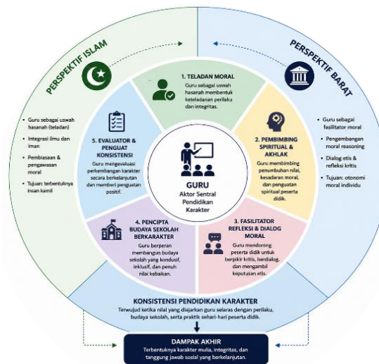
Gambar 2. Guru Menjadi Variabel Kunci dalam Konsistensi Pendidikan Karakter

Dalam perspektif Barat, guru juga dipandang memiliki peran penting sebagai fasilitator dialog moral dan pembentukan kesadaran etis peserta didik. Akan tetapi, pendekatan ini sering menghadapi keterbatasan ketika institusi pendidikan gagal membangun kultur moral yang mendukung proses refleksi tersebut. Akibatnya, pendidikan karakter menjadi individualistik dan kehilangan basis sosial yang kuat.