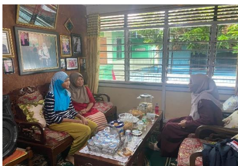
Gambar 3. Perhatian guru terhadap kondisi siswa

Selanjutnya Adapun dokumentasi mengenai materi sikap empati dan toleransi