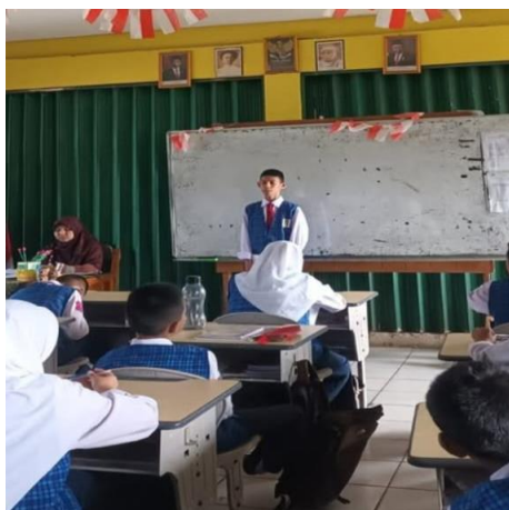
Gambar 4. Anak yang di berikan hukuman hapalan

Gambar di atas ini menunjukkan siswa yang melanggar seperti terlambat masuk kelas dan di berikan hukuman oleh guru yang berada lebih awal di kelas, hukuman yang di berikan kepada siswa berupa seperti hapalan Al-Qur'an dan doa-doa keseharian.