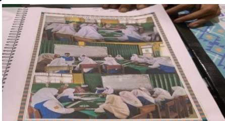
Gambar 1. arahan atau nasihat kepada siswa di dalam kelas.

Selanjutnya Adapun dokumentasi mengenai materi Penerapan Ketegasan Guru dalam Menegakkan Disiplin siswa