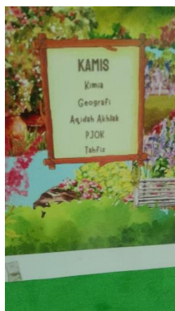
Gambar 2. Jadwal Pelajaran Tahfizh

“Kegiatan tahfizh dilaksanakan dua jam pelajaran dalam satu minggu untuk mata pelajaran tahfizh di kelas, dan untuk kegiatan ekstrakurikuler dilaksanakan setiap hari Sabtu. Program ini berjalan sesuai jadwal yang telah ditetapkan oleh madrasah.” (Wawancara 21/April/2026)