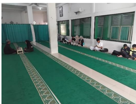
Gambar 3. Dokumentasi ekstrakurikuler tahfizh

Berdasarkan hasil dokumentasi jadwal pembelajaran tahfizh di kelas, diketahui bahwa program tahfizh telah masuk ke dalam struktur pembelajaran madrasah sebagai mata pelajaran resmi yang dilaksanakan sebanyak 2 jam pelajaran setiap minggu. Jadwal pembelajaran tersebut menunjukkan bahwa program tahfizh tidak hanya menjadi kegiatan tambahan, tetapi telah menjadi bagian dari kurikulum pembelajaran madrasah. Dalam kegiatan intrakurikuler, peserta didik melakukan hafalan baru, setoran hafalan, muroja'ah, serta menerima bimbingan langsung dari guru tahfizh. Selain itu, hasil hafalan peserta didik juga masuk dalam sistem penilaian akademik madrasah.