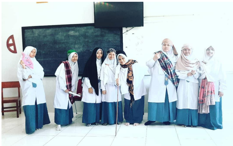
Gambar 2. Praktik Pementasan Drama Cerita Rakyat

Dalam projek pementasan cerita rakyat pada kelas X, model komunikasi transaksional diwujudkan melalui proses kerja sama kelompok yang intensif. Siswa dituntut untuk mentransformasikan teks literatur menjadi sebuah pertunjukan peran, yang mengharuskan adanya interaksi simultan antara pengirim dan penerima pesan di antara sesama anggota kelompok. Pementasan ini bukan sekadar aktivitas hiburan, melainkan proses edukatif terencana yang melibatkan aspek kognitif dan sosial siswa untuk memahami nilai moral secara mendalam melalui dialog dan partisipasi aktif. Guru dalam kegiatan ini melepaskan peran sebagai sumber informasi tunggal dan beralih menjadi fasilitator yang mendorong kolaborasi, sehingga tercipta hubungan pedagogis yang humanis. Adapun dokumentasinya sebagai berikut :