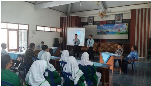
Gambar 4 dan 5. Projek Eksplorasi Potensi Desa