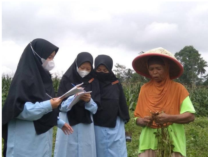
Gambar 3. Proyek wawancara permasalahan sosial

Implementasi model komunikasi transaksional dalam pembelajaran teks eksposisi di SMA MBS Zam-Zam mencapai puncaknya melalui proyek eksplorasi potensi wisata Situ Elok, di mana santri bertransformasi dari penerima teori yang pasif menjadi subjek aktif yang mengonstruksi solusi nyata bagi masyarakat desa. Melalui observasi langsung dan dialog interaktif di lapangan, santri berhasil meruntuhkan dinding kejenuhan "penjara suci" pesantren dan menggantinya dengan antusiasme tinggi untuk menyusun ide pengembangan desa yang kemudian dipresentasikan secara lugas di hadapan Kepala Desa Pernasidi di Balai Desa setempat. Proses ini membuktikan bahwa penciptaan makna bersama ( shared meaning ) antara santri dan perangkat kebijakan desa tidak hanya meningkatkan kemampuan berpikir kritis dan kepercayaan diri mereka, tetapi juga memberikan dampak nyata bagi pengembangan potensi lokal sekaligus mengubah paradigma pembelajaran menjadi lebih humanis, kontekstual, dan transformatif. Adapun dokumentasinya sebagai berikut :