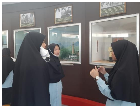
Gambar 6. Projek Kunjungan Museum

Terakhir, projek resensi buku yang dilakukan di perpustakaan sekolah menonjolkan karakteristik komunikasi pendidikan yang berorientasi pada perkembangan intelektual dan pembentukan karakter. Di dalam ruang perpustakaan, terjadi pertukaran pesan antara siswa dengan teks bacaan serta diskusi kritis dengan rekan sejawat yang dimediasi oleh umpan balik berkelanjutan. Lingkungan belajar yang kondusif ini memungkinkan siswa untuk berpikir, bertanya, dan memahami materi secara mendalam, sesuai dengan prinsip student-centered learning . Dokumentasi kegiatannya sebagai berikut: